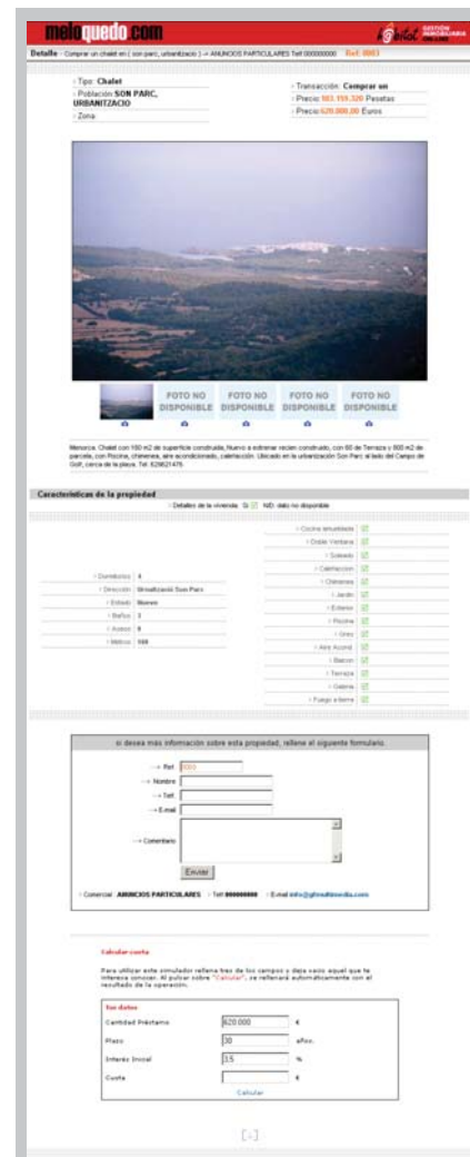
Pantalla de presentación de un inmueble.