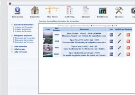
Desde el panel de control podrá visualizar los datos e imágenes en tiempo real y poder modificarlos a su antojo.