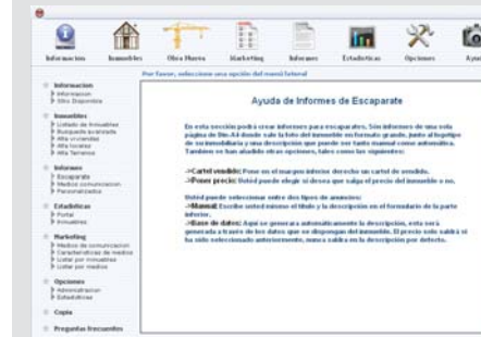
La ayuda dentro del mismo panel de control facilita el manejo y guía paso a paso su utilización.