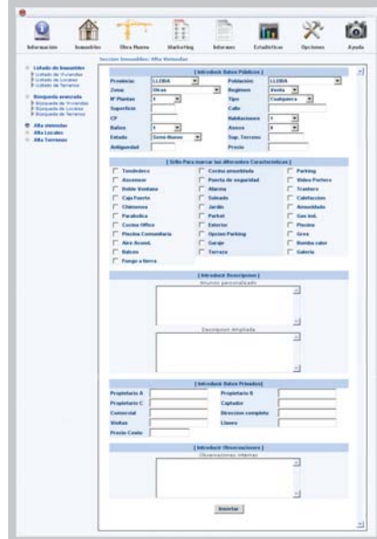
Introducción de datos de un inmueble.