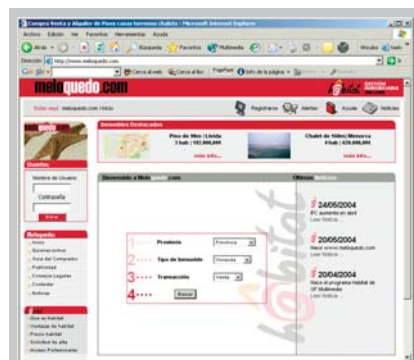
Pantalla del portal meloquedo.com vista de la ventana principal.